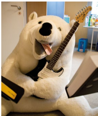
Musibär - das Maskottchen der Früherziehung

viel Bewegung zur Musik. Ein großer Schrank voller Materialien und Instrumente wartet nur darauf, von den Kindern entdeckt zu werden.