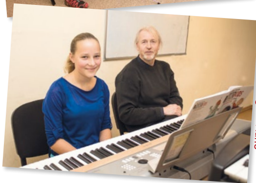
Unterricht am Digital-Piano